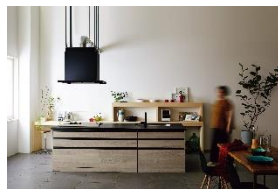
クリナップシステムキッチン 『STEDIA』

日時 2025年2月1日(土) 会場 クリナップ・キッチンタウン・東京 (新宿ショールーム) 東京都新宿区西新宿3-2-11 新宿三井ビルディング2号館6F