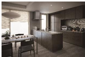
TOTOシステムキッチン 『ザ・クラッソ』