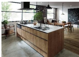
LIXILシステムキッチン 『ノクト』