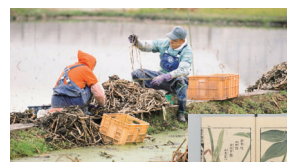
出展：図譜(1828年) 国立公本草文書館所蔵

ぐんぐん芽が伸びることから、縁起物として重宝される「くわい」。おせち料理に欠かせない食材として、日本では古くから親しまれてきました。その栽培は田んぼで、低地の多い埼玉は生産量が全国2位。11月中旬からの1ヶ月弱で収穫・出荷されています。