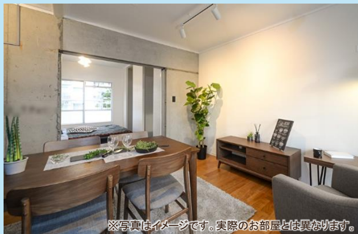
※写真はイメージです。実際のお部屋とは異なります。