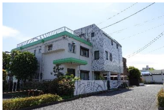
【江崎小児クリニック】