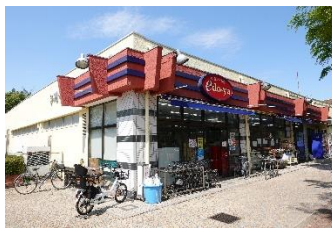
【ミリオンショップ江戸や】