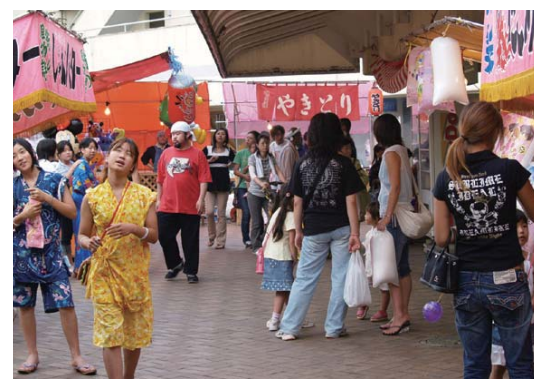
■7月中旬2日間に渡り開催される地域祭り。商店街にたくさんのお店が出てにぎわいます。