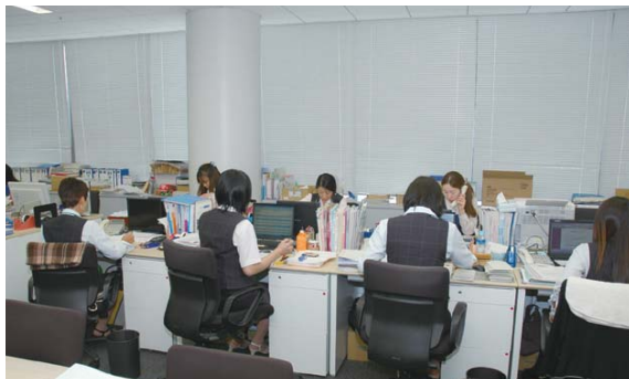
◀保険の契約や内容をご案内する保険センタースタッフ

——「火災保険が主体になりますが、実際には火災がそう多くないこともあり、賃貸住宅にお住まいの方が関心を寄せられるのは、何といたっても水漏れ事故による階下の方への個人賠償です。壁やクロス、布団や