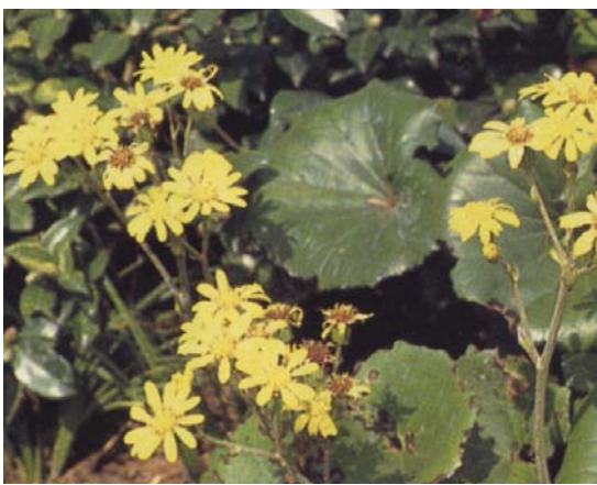
ツワブキ ／キク科／花期 10～11月 日陰にもよく耐えます。花後の花茎の切り取りや、株分けなどの管理をします。