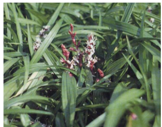
キチジョウソウ ／ユリ科／花期 9～10月 建物の北側の日陰地によく使われます。刈りこんだりしないで自然な感じを生かします。