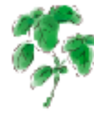
●ハーブの王様 バジル

お花屋さんでよく見かけ、人気の高い品種をピックアップしました。育てやすいのでビギナー向けです。