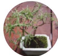
ローズマリーを さし木で盆栽風に。