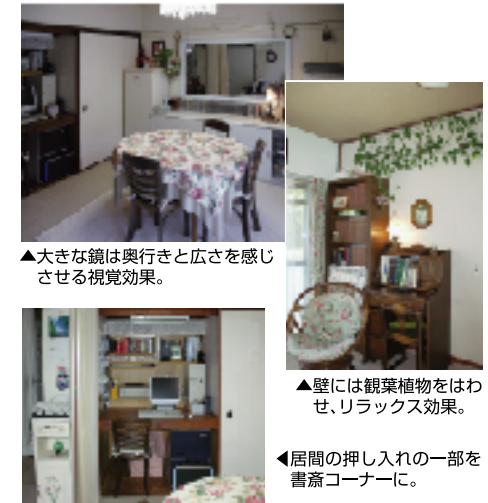
▲大きな鏡は奥行きと広さを感じさせる視覚効果。