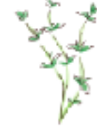
●清涼かつスパイシー タイム

香りが強いので肉料理などの風味づけに最適。若さを保つハーブとしても知られ入浴剤にも利用できます。