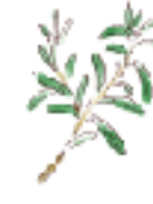
●野性的な香り ローズマリー

種類は多彩ですが、スイートバジルが代表的。イタリア料理には欠かせませんね。収穫量が多いので、ひと鉢があると料理の幅もグンと広がります。