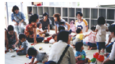
■若いお母さんの懇談会

「花見川たすけあいの会“ハンド♥ハンド”という活動があります。これは、部屋の掃除や買い物、食事作りなど、高齢者などの依頼に対し、会に登録しているボランティアを派遣します。7年前に自治会役員の発案でスタートしましたが、自治会とは別組織に発展し成長してきました。“私たちにできることなら”と住民のボランティア登録者も増え、今では1時間に500円をいただくなど金銭のやり取りも含め、組織的に運営することで援助する側もされる側も余計な気を遣うことなく気持ちよく活動できているのではと思います」さらに、子育て支援の話しに及びます。