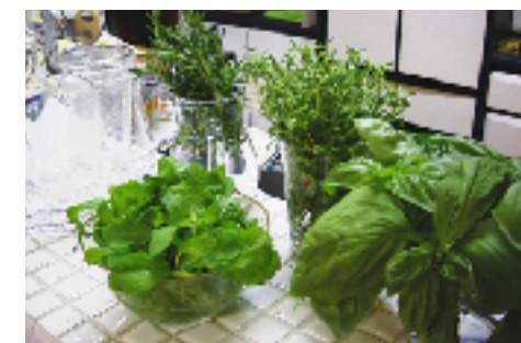
左よりスペアミント、ローズマリー、タイム、スイートバジル

な時は今までの恵みに感謝してから、思い切って処分を。自分で育てて眺めて食べて・心を込めて植物と付き合いさえきっと満足できると思います」