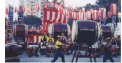
■花見川名物のほのぼの太鼓