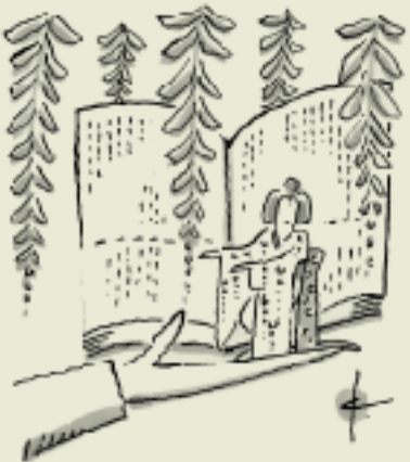
イラスト・ナメ川コーイチ

平成中村座を率い、来年、11代目中村勘三郎を襲名する勘九郎が10歳のころのことである。梅幸は師匠・6代目の息子で菊五郎劇団の代表、後に人間国宝になった女形。辛口多賀之丞の面目躍如である。