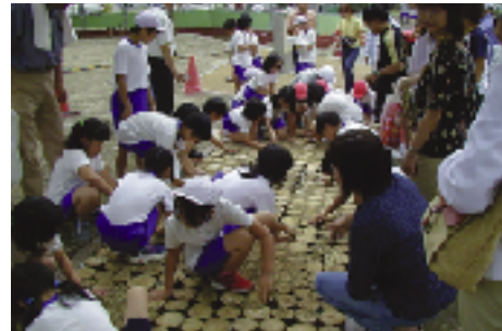
団地の近隣の小学生たちが、総合学習の一環として作り上げた団地内公園です。団地環境整備工事で伐採した木を再利用しています。名古屋市豊成団地