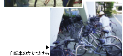
自転車のかたづけも