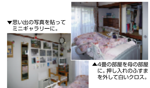
▼思い出の写真を貼ってミニギャラリーに。