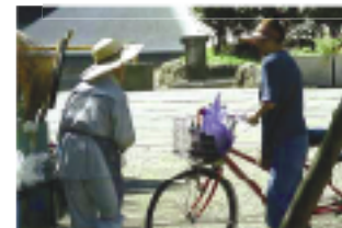
こんにちはの挨拶

クリーンメイトは、清掃業務はもちろんのこと、常駐のメリットを生かし、快適で安全な団地生活全体を総合的にサポートしています。