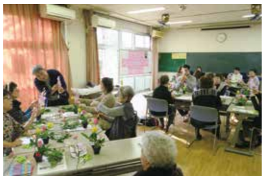
フラワーアレンジメント体験教室