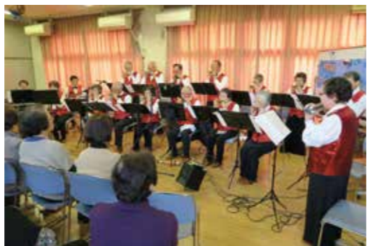
ハーモニカ演奏会

総勢一七名によるクロマチックハーモニカを主体とした豊かな音色の演奏に、参加者は聞き入っていました。曲目の最後は会場にいる全員で歌って終わり、会場の一体感も生まれました。